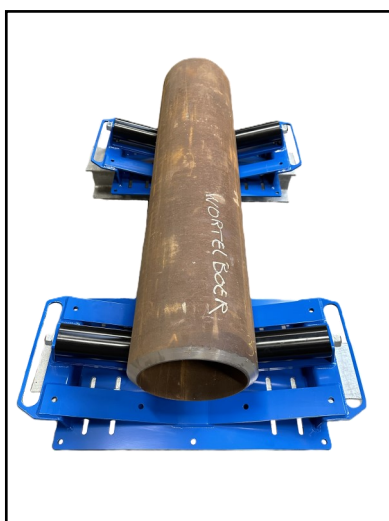
Uitvoering met enkele rollen voor in LENGTE rollen van de 10" pijp.

De rollenbokken kunnen uitgerust worden met stalen - gezwarte - rollen OF met stalen rollen met een POLYURETHAAN type P700 D coating van ca. 8,5 mm. dikte.