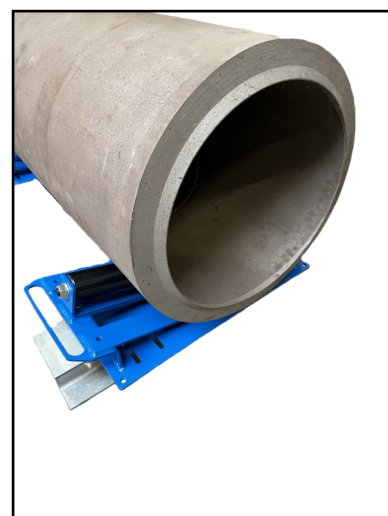
Uitvoering met enkele rollen voor in LENGTE rollen van de 24" pijp.